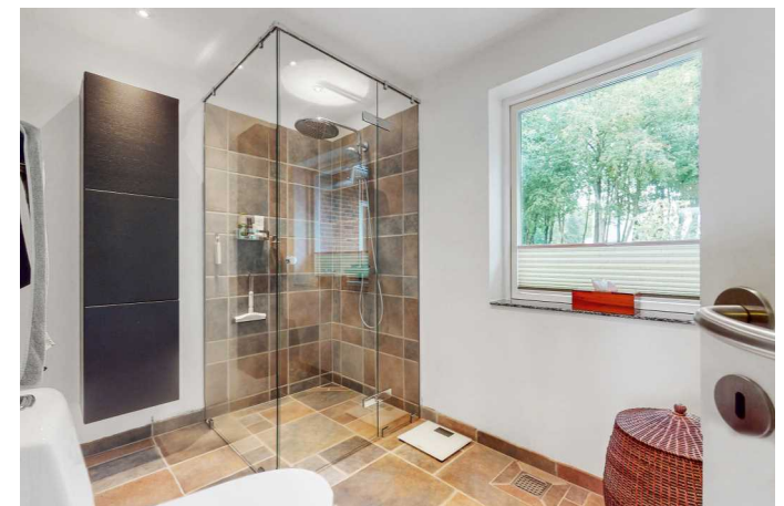
Badeværelse i stueplan