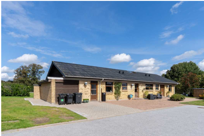
Set fra vejen