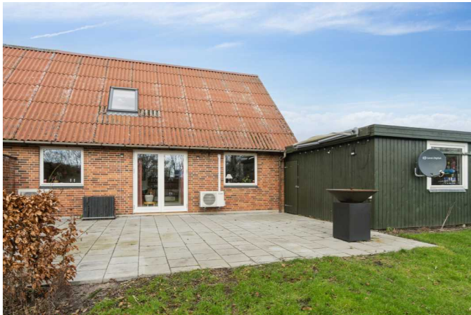
Set fra haven